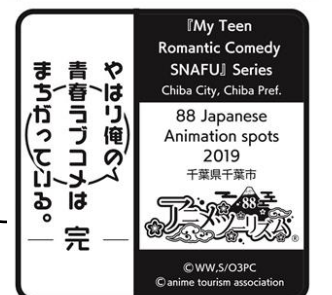
ご朱印スタンプ （約8cm×8cm）