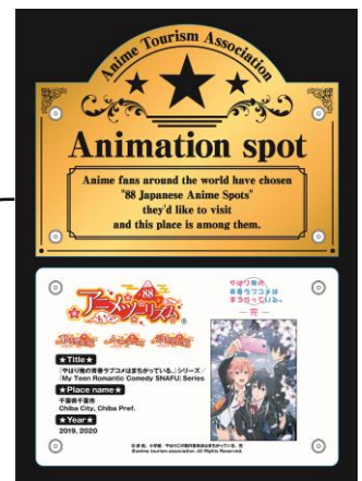
聖地認定プレート