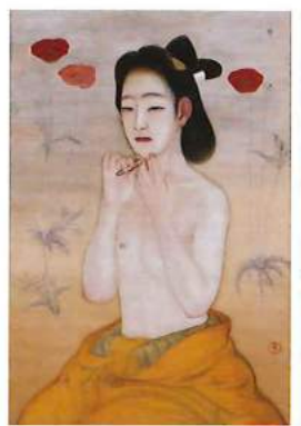
甲斐庄楠音(毛毡)大正4(1915)年頃 京都国立近代美術館