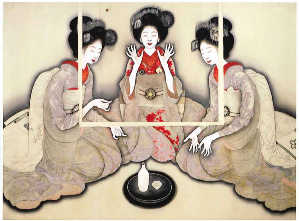
岡本神草(拳を打てる三人の舞妓の習作) 大正9(1920)年 京都国立近代美術館

て注目を集めました。大正9年、第3回国展に出品した《拳を打てる三人の舞妓の習作》では官能性の先にある神秘的な存在感を追求し、将来を期待されるようになります。その後菊池契月に師事し、新たな展開を模索するなか、昭和8(1933)年に38歳の若さで急逝しました。今回は《口紅》《拳を打てる三人の舞妓の習作》等のこれまでに知られている作品をはじめ、寡作で知られる岡本神草の数少ない完成作を可能な限り集め、素描・下図・資料類約100点の他に甲斐庄楠音など共に競い合った仲間や師の契月などの作品も展示します。本展覧会は昨秋京都国立近代美術館で開催され、大きな反響を呼びました。東日本で唯一本展を開催する千葉市美術館は、巡回の最終会場となります。 ●会期中、展示替を行います。