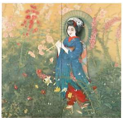
丸岡比呂史(夏の苑)大正末期 京都国立近代美術館