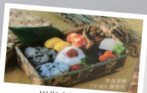
ソムリエ自作創作料理