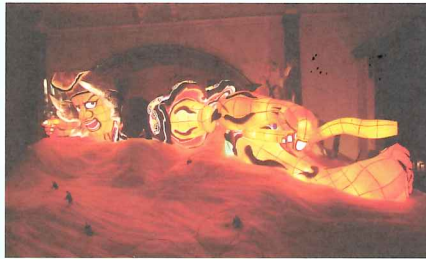
《金沢七不思議》2008, 金沢21世紀美術館蔵