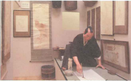
《醤油画資料館》1999, 福岡アジア美術館蔵

本展は小沢にとって、関東で開催される久々の大規模個展となります。この機会にぜひ、そのユニークな作品世界に触れてください。