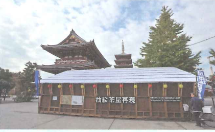
《油絵茶屋再現》2011, 作家蔵